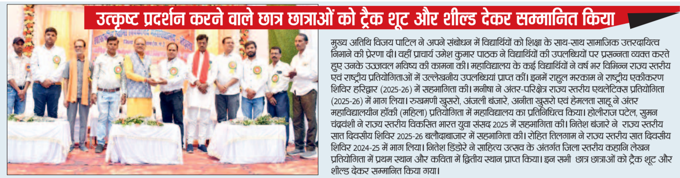
उत्कृष्ट प्रदर्शन करने वाले छात्र छात्राओं को ट्रैक शूट और शील्ड देकर सम्मानित किया