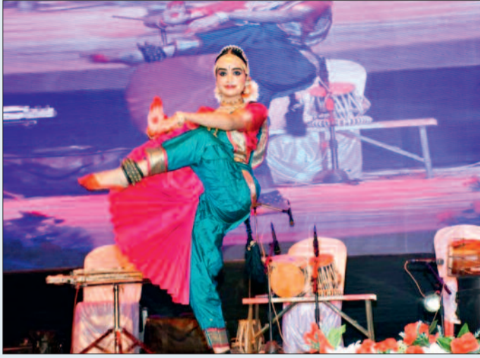
लोक व शास्त्रीय प्रस्तुतियों से सजी भोरमदेव की थांग

यहां बताना लाजिमी होगा कि बीते वर्ष भोरमदेव परिसर में आयोजित भोरमदेव महोत्सव के पहले ही दिन कुछ आसामाजिक तत्वों ने महोत्सव की गरिमा को ठेस पहुंचाते हुए जमकर हंगामा किया था और सैकड़ों की संख्या में कुत्तियां तोड़ी थीं। इस बात को ध्यान में रखते हुए इस बार पुलिस प्रशासन ने महोत्सव में सुरक्षा व्यवस्था को चाक चौबंद करने करीब 400 की संख्या में सुरक्षा बल और पुलिस अधिकारियों को तैनात किया था। जिसके चलते महोत्सव से इस बार बीते वर्ष की तरह घटित कोई घटना की खबर नहीं मिली है।