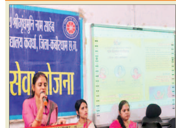
पीजी कॉलेज में महिला सशक्तिकरण पर एक दिवसीय कार्यशाला आयोजित