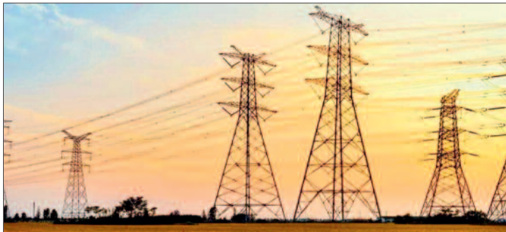
देखते हुए कोई विशेष इंतजाम नहीं किए हैं बताना लाजिमी होगा कि शीत ऋतु की समाप्ती और सब कुछ पुराने ढर्रे पर ही चल रहा है। यहां के बाद गर्मी के जोर पकड़ने के साथ ही

बढ़ती गर्मी के साथ कवर्धा नगर सहित आसपास के ग्रामीण इलाकों में एक बार फिर बिजली ने झटका देना शुरू कर दिया है। माना जा रहा है कि यह विद्युत विभाग की अनेदखी और अव्यवस्था का नतीजा है जिसका खामियाजा अब उपभोक्ताओं को पूरी गर्मी भर भुगताना पड़ सकता है। गौरतलब है कि मार्च माह के शुरूआती दिनों से ही गर्मी अपने तेवर दिखाने लगी है। लेकिन हर बार की तरह इस बार भी विद्युत विभाग ने ग्राम ऋतु में अचानक बढ़ने वाली विद्युत की खपत को