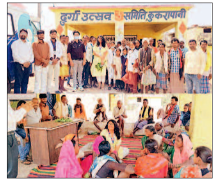
संबंध में ग्रामीणों से संवाद किया तथा हितग्राहियों से सीधे बातचीत कर उनके अनुभव एवं सुझाव प्राप्त किए। साथ ही, कुछ चयनित लाभार्थियों से केस स्टडी के लिए विस्तृत चर्चा भी की गई, जिससे परियोजना के प्रभाव का भूल्यांकन

साथ बैठक आयोजित की। इस दौरान उन्होंने परियोजना के माध्यम से प्रदान की जा रही स्वास्थ्य सेवाओं के